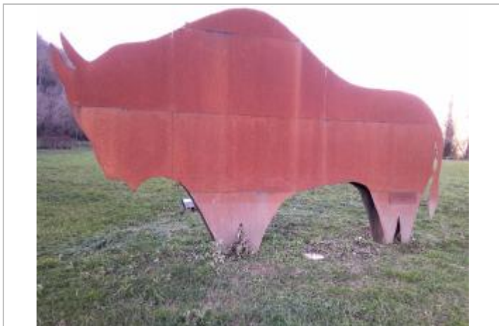
Vue de laisse

Altitude calculée de l'eau (en m) : 59.435 m