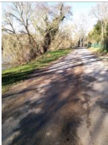
Vue de laisse

Altitude calculée de l'eau (en m) : 53.583 m