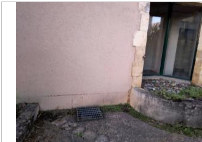
Vue de laisse

Altitude calculée de l'eau (en m) : 53.052 m