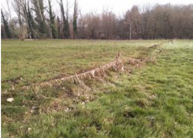
Vue de laisse - auteur : SPC GAD

Altitude calculée de l'eau (en m) : 50.591 m