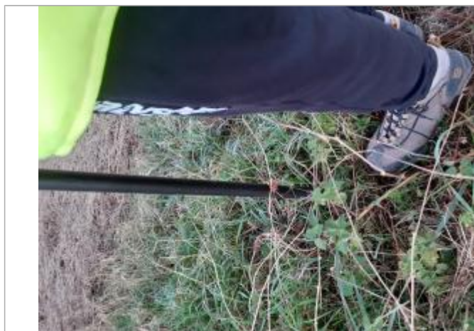
Vue de laisse