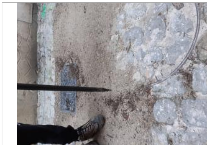
Vue de laisse

SOURCE DE REPÉRAGE : RELEVÉS DE LAISSES DE LA CRUE DE DÉCEMBRE 2023 SUR LA VÉZÈRE AVAL - 18/12/2023