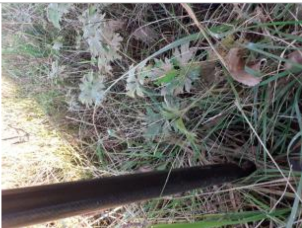
Vue de laisse

Altitude calculée de l'eau (en m) : 73.87 m