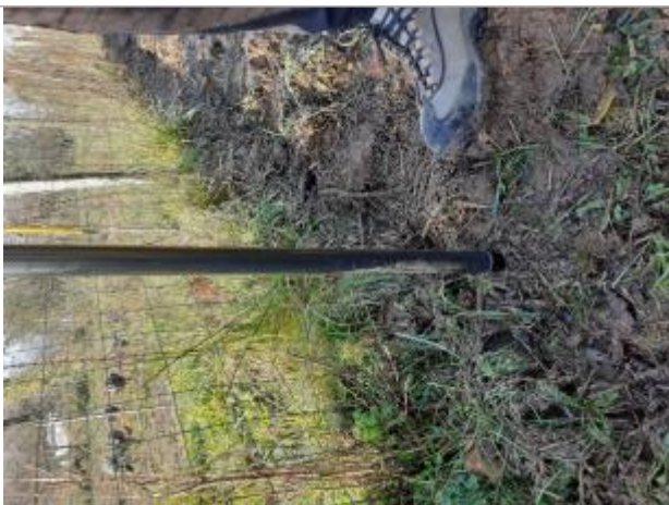
Vue de laisse

Altitude calculée de l'eau (en m) : 85.47 m