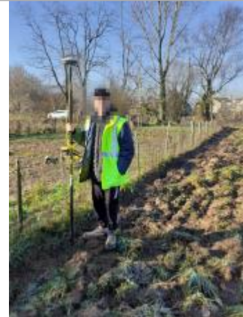
Vue du site - auteur : SPC GAD

Coordonnées WGS84 : X: 1.30959840 / Y: 45.13309670