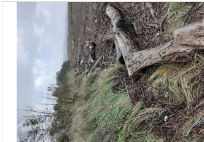
Vue de laisse

Altitude calculée de l'eau (en m) : 3.35 m