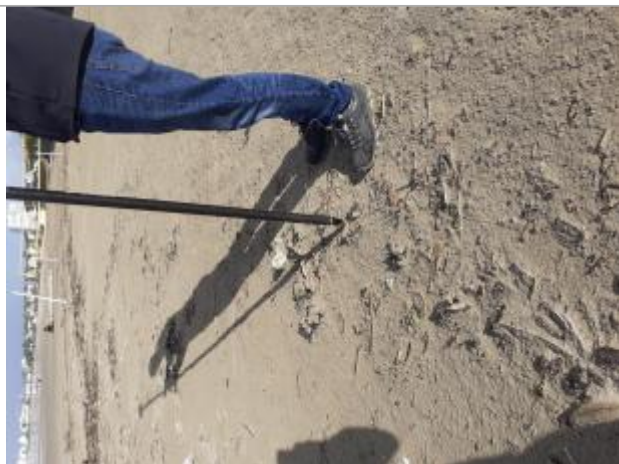
Vue de laisse - auteur : SPC GAD

Altitude calculée de l'eau (en m) : 4.24 m