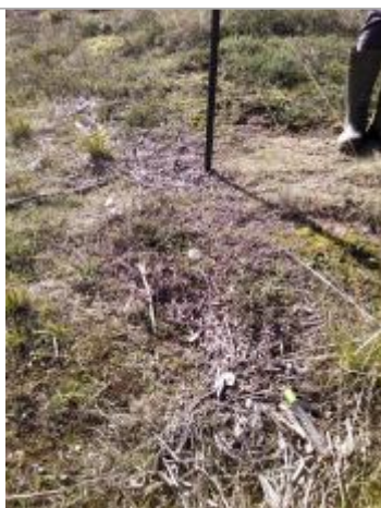
Vue de laisse