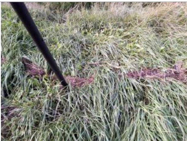
Vue de laisse

Altitude calculée de l'eau (en m) : 3.492 m