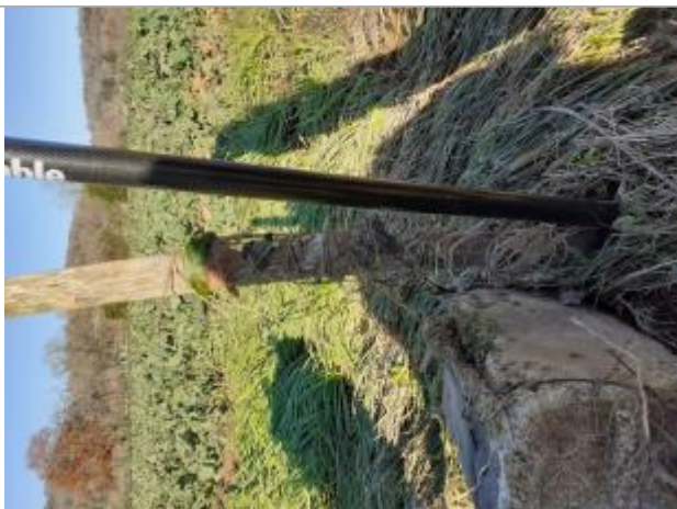
Vue de laisse - auteur : SPC GAD

Altitude calculée de l'eau (en m) : 79.82