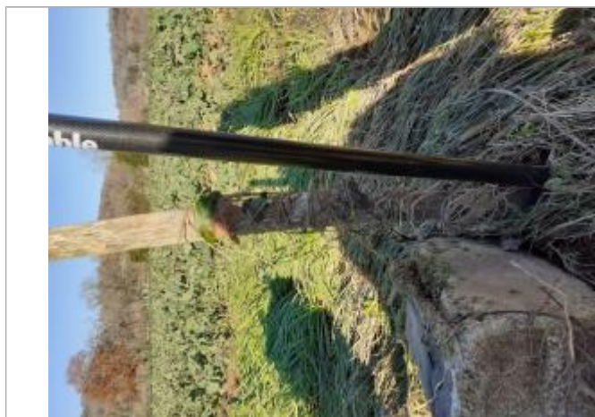
Vue de laisse