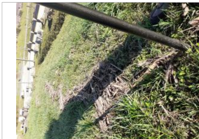
Vue de laisse