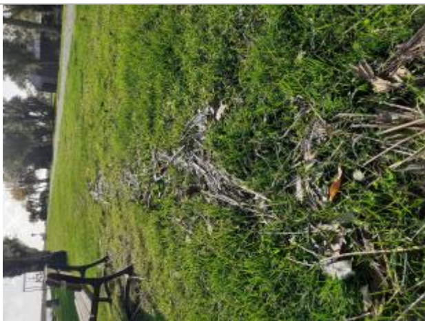
Vue de laisse - auteur : SPC GAD

Altitude calculée de l'eau (en m) : 3.44