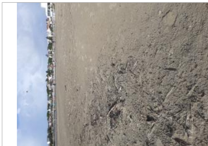
Vue de laisse