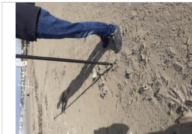
Vue de laisse

Altitude calculée de l'eau (en m) : 4.24