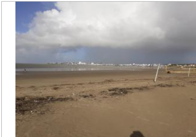
Vue du site - auteur : SPC GAD