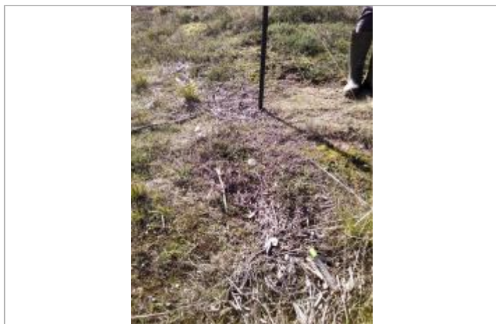
Vue de laisse - auteur : SPC GAD

Altitude calculée de l'eau (en m) : 3.442