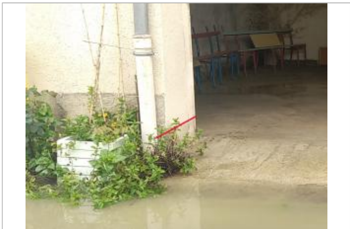
2023/05 - Laisse inondation

MARQUE Visibilité : Oui État du repère : Bon Pérennité : Longue