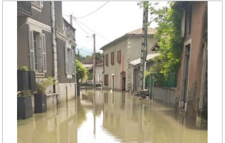
2023/05 - Garage