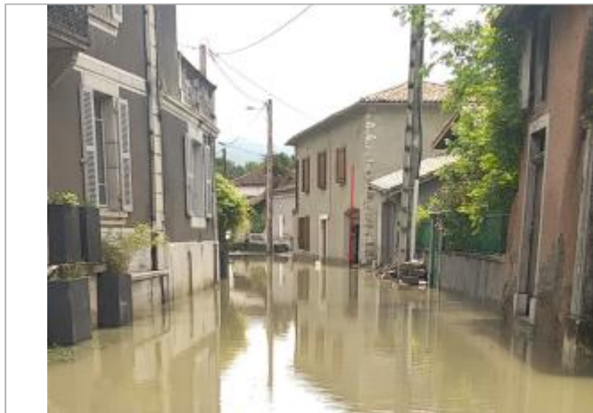
2023/05 - Garage