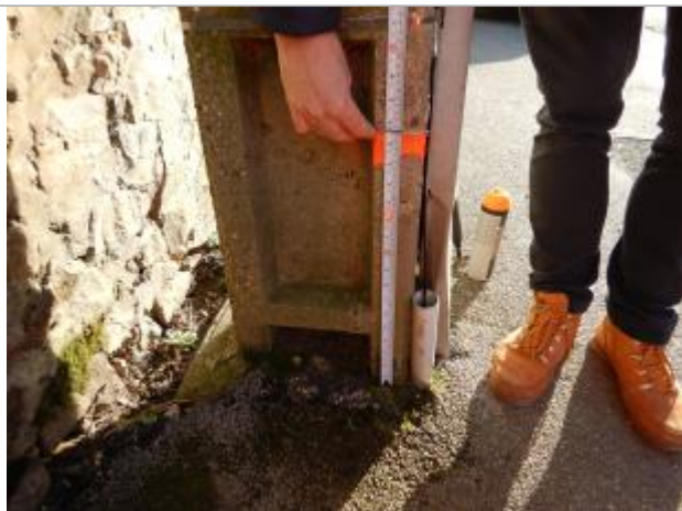
Le repère est au pieds d'un poteau électrique

LE NIVELLEMENT A ÉTÉ RÉALISÉ PAR LE SYMCÉA. LE SYMCÉA N'EST PAS EXPERT GÉOMÈTRE. LA VALEUR RENSEIGNÉE EST DONC À TITRE INDICATIVE. - 26/01/2024