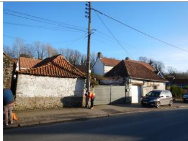
Le site est un poteau électrique.