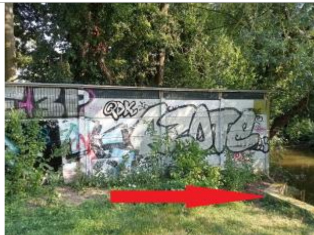
Site de l'ancienne passerelle, rive gauche en aval