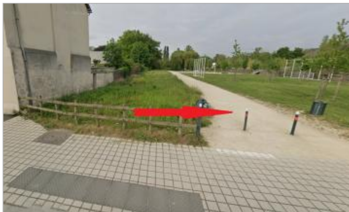
Coulée verte au niveau de la rue de la Motte Brûlon