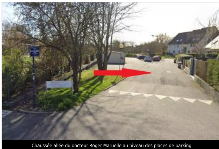
Chaussée allée du docteur Roger Maruelle au niveau des places de parking

Coordonnées WGS84 : X: -1.67035117 / Y: 48.12705730