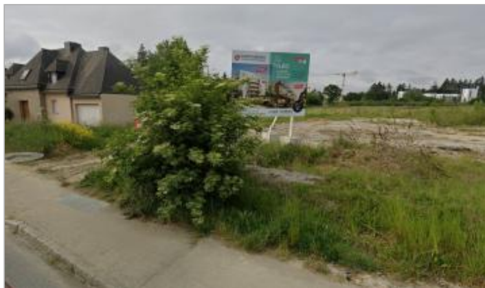
Nouveau quartier rue des folies en cours d'aménagement