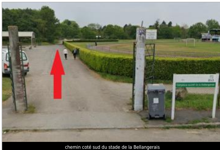
chemin coté sud du stade de la Bellangerais