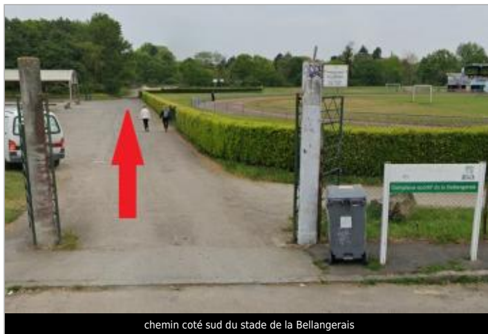
chemin coté sud du stade de la Bellangerais