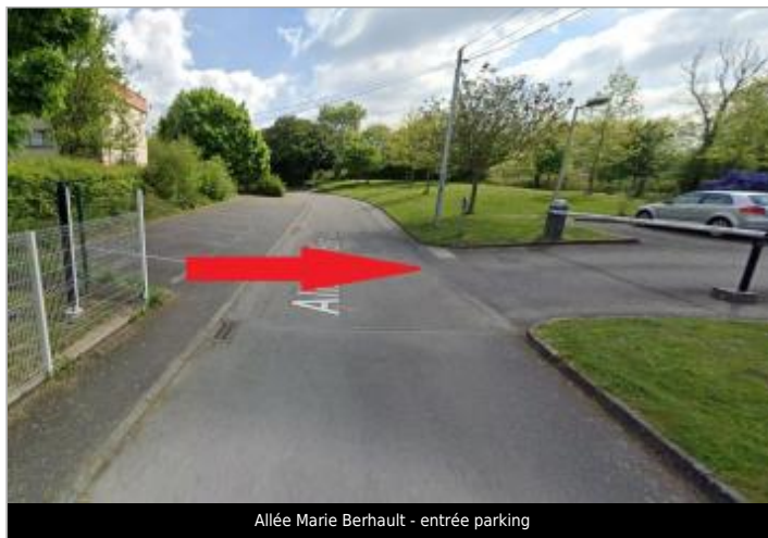
Allée Marie Berhault - entrée parking