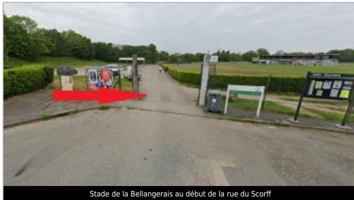
Stade de la Bellangerais au début de la rue du Scorff