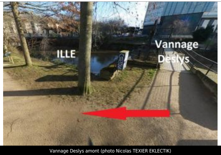
Vannage Deslys amont

Coordonnées WGS84 : X: -1.68888008 / Y: 48.11485720