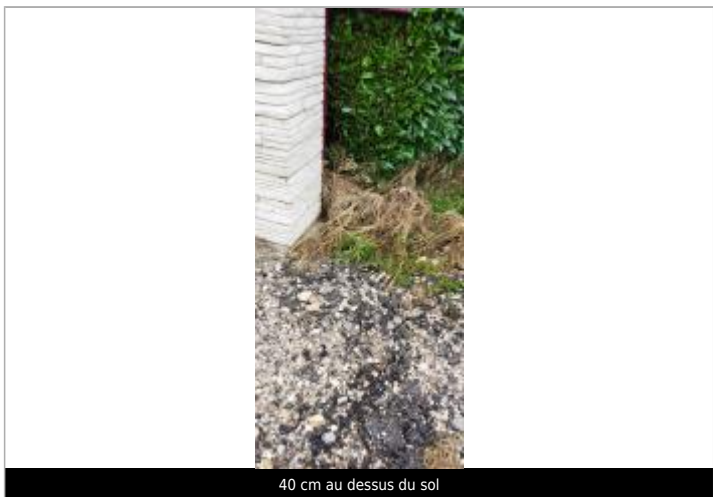
40 cm au dessus du sol

MARQUE Visibilité : Oui État du repère : Mauvais Pérennité : Aucune