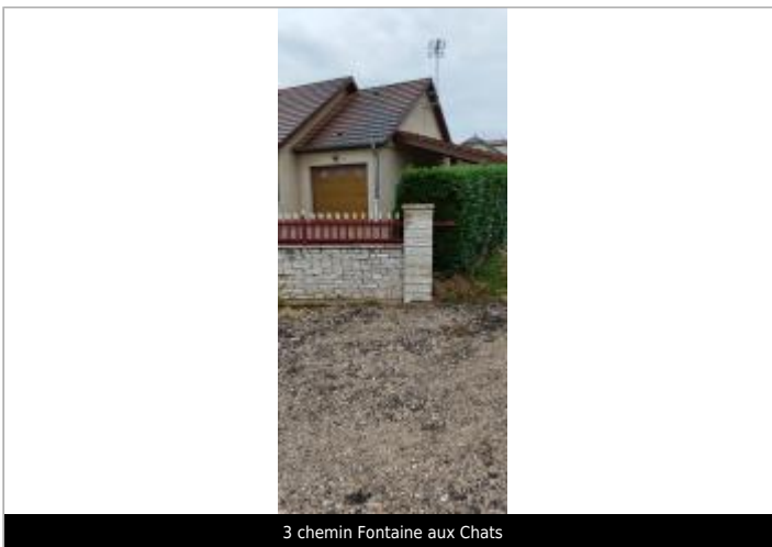
3 chemin Fontaine aux Chats

GÉOLOCALISATION Coordonnées WGS84 : X: 6.10182413 / Y: 47.81215220 Coordonnées RGF93 (Lambert 93) X: 932093 / Y: 6750310 Coordonnées RGF93 (ETRS89) : X: 6.1018241 / Y: 47.8121522