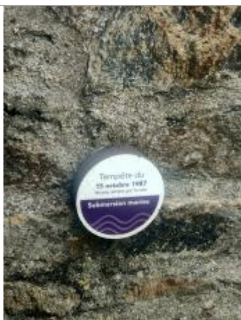
Tempête du 15 octobre 1987 - Port-Anna, Séné

Altitude calculée de l'eau (en m) : 3.39 m