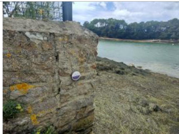
Port-Anna - Séné

Coordonnées WGS84 : X: -2.77930385 / Y: 47.62335790