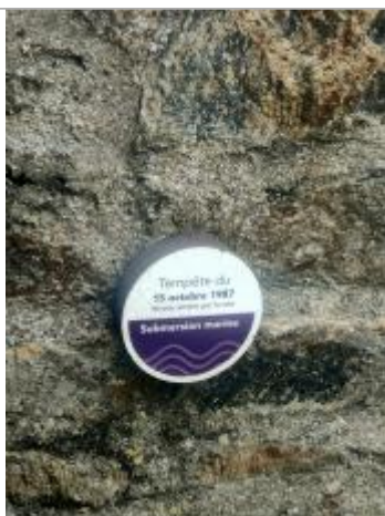
Tempête du 15 octobre 1987 - Port-Anna, Séné

Altitude calculée de l'eau (en m) : 3.39 m