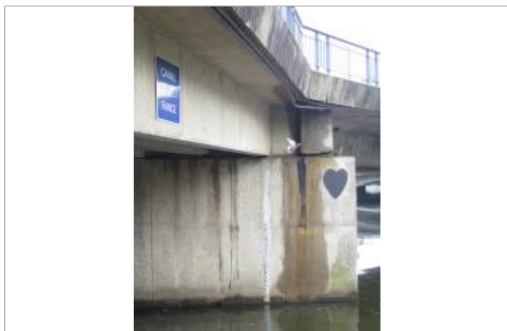
Echelle limnimétrique en aval de l'écluse du Mail

Altitude calculée de l'eau (en m) : 24.884 m