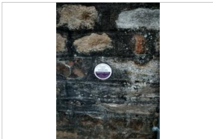
Tempête Céline - 20 octobre 2023 - Rive gauche, Vannes

Altitude calculée de l'eau (en m) : 3.02 m