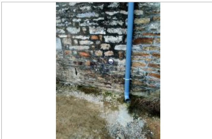
Rive gauche - Vannes