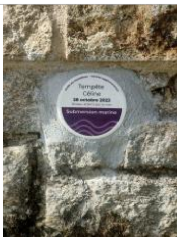
Tempête Céline - 28 octobre 2023 - Berder, Larmor-Baden

Altitude calculée de l'eau (en m) : 3.35