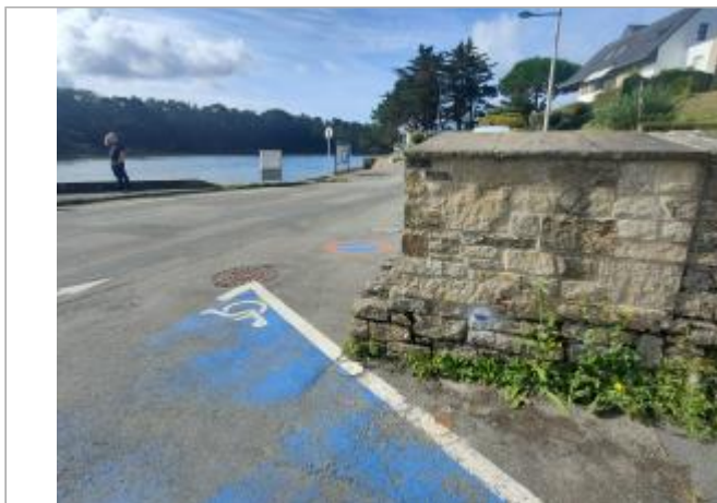
Berder - Larmor-Baden