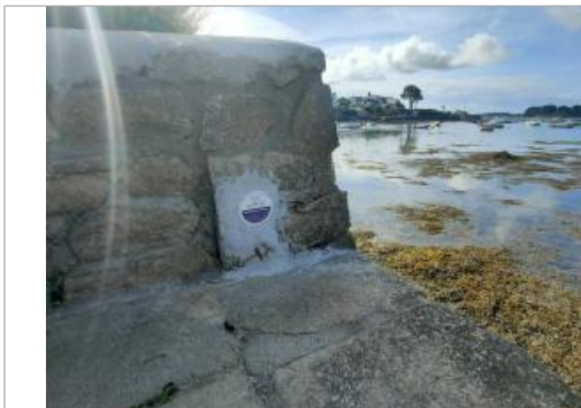
Sentier de la plage - Larmor-Baden

Coordonnées WGS84 : X: -2.89679811 / Y: 47.58540050