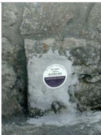
Tempête Céline - 28 octobre 2023 - Sentier de la plage, Arradon

Altitude calculée de l'eau (en m) : 3.24 m