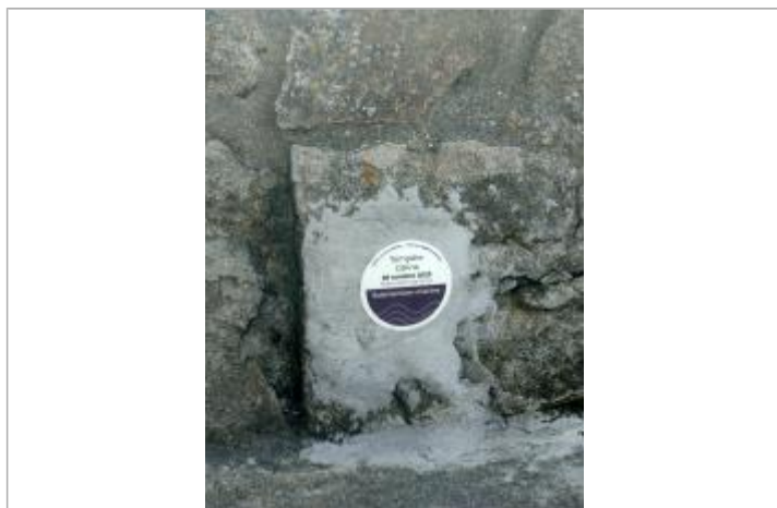
Tempête Céline - 28 octobre 2023 - Sentier de la plage, Arradon

Altitude calculée de l'eau (en m) : 3.24 m