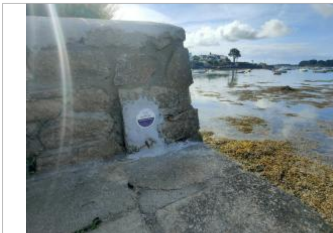
Sentier de la plage - Larmor-Baden