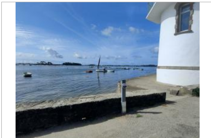
Tour Vincent, Arradon