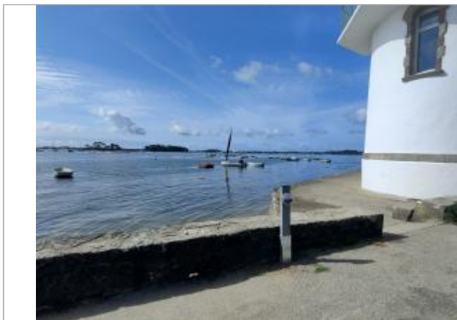
Tour Vincent, Arradon

Coordonnées WGS84 : X: -2.81664000 / Y: 47.62121900