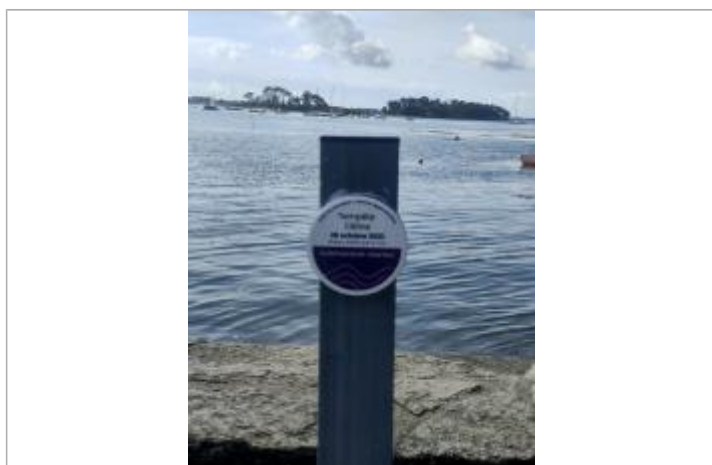
Submersion marine lors de la tempête Céline du 28 octobre 2023

Altitude calculée de l'eau (en m) : 3.21 m