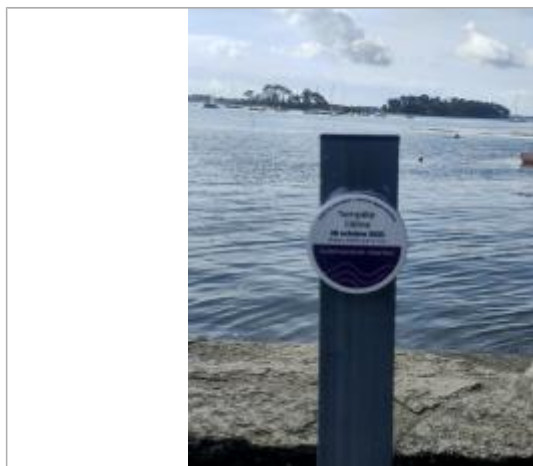
Submersion marine lors de la tempête Céline du 28 octobre 2023

Altitude calculée de l'eau (en m) : 3.21 m