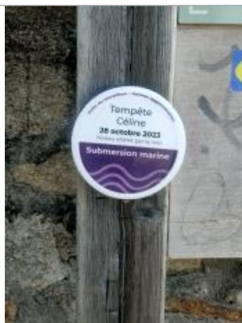
Tempête Céline - 28 octobre 2023 - Kerbilouët, Arradon

Altitude calculée de l'eau (en m) : 3.25 m