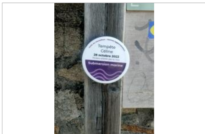
Tempête Céline - 28 octobre 2023 - Kerbilouët, Arradon

SOURCE DE REPÉRAGE : GOLFE DU MORBIHAN VANNES AGGLOMÉRATION - 01/01/2001