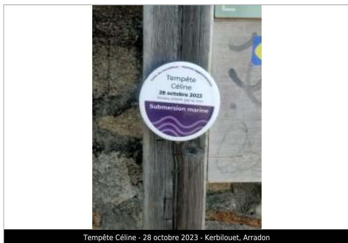
Tempête Céline - 28 octobre 2023 - Kerbilouët, Arradon

Altitude calculée de l'eau (en m) : 3.25