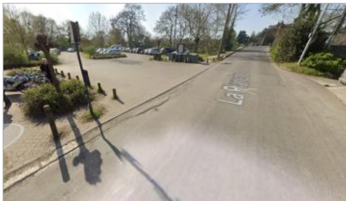
Apigné entrée du parking