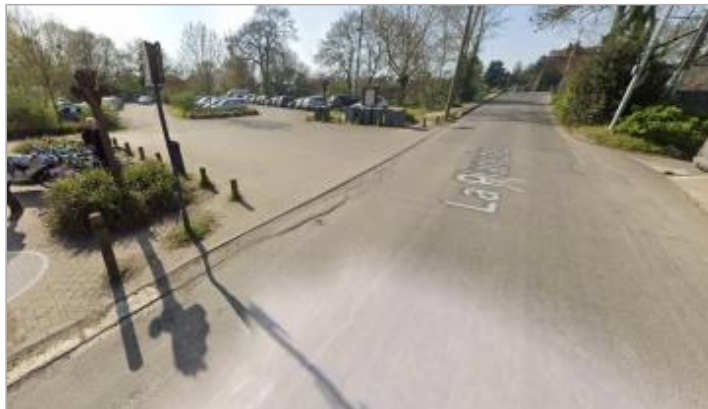
Apigné entrée du parking