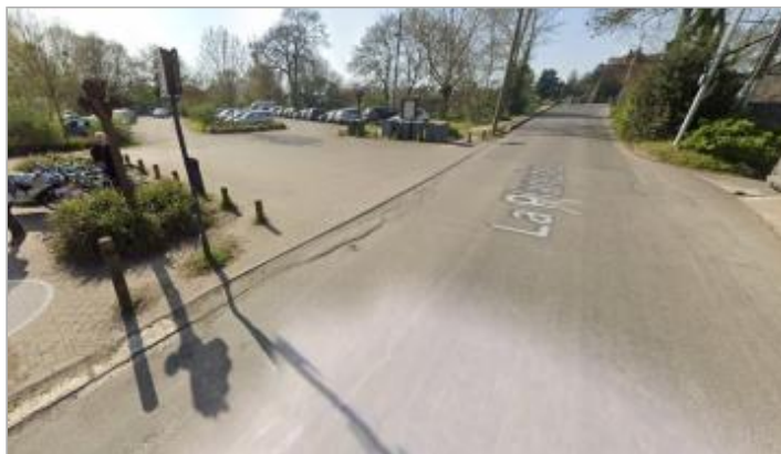
Apigné entrée du parking