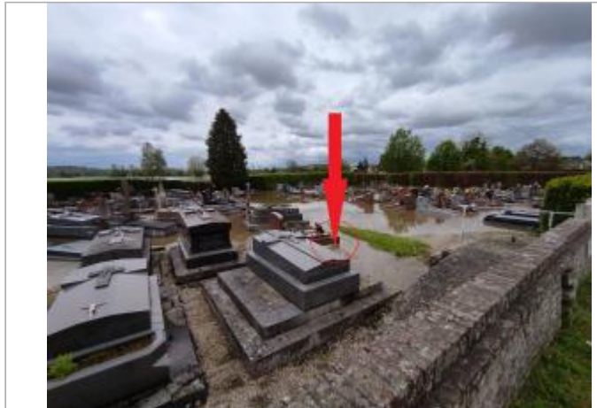
Vue depuis la RD511 pendant la crue.

Coordonnées WGS84 : X: 0.09114281 / Y: 49.07217200