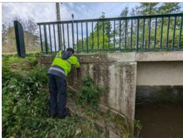
Laisse de crue nivelée directement

Altitude calculée de l'eau (en m) : 33.93