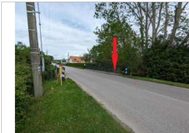
Vue depuis la RD511 en rive gauche.