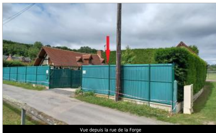
Vue depuis la rue de la Forge

GÉOLOCALISATION Coordonnées WGS84 : X: 0.36793278 / Y: 49.08367080 Coordonnées RGF93 (Lambert 93) X: 507752.7 / Y: 6890296.48 Coordonnées RGF93 (ETRS89) : X: 0.3679328 / Y: 49.0836708 Code Hydro: I02-0410 Rive de référence: Gauche