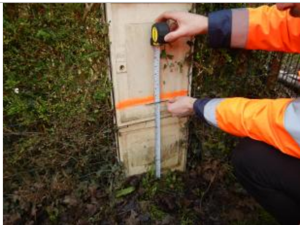
Le repère est sur le coffre électrique.

LE NIVELLEMENT A ÉTÉ RÉALISÉ PAR LE SYMCÉA. LE SYMCÉA N'EST PAS EXPERT GÉOMÈTRE. LA VALEUR RENSEIGNÉE EST DONC À TITRE INDICATIVE. - 25/01/2024