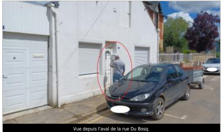
Vue depuis l'aval de la rue Du Bosq.

Coordonnées WGS84 : X: -0.02726440 / Y: 49.01815160