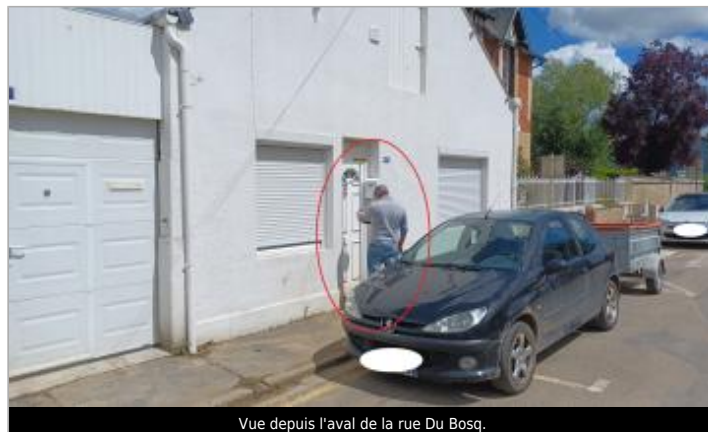
Vue depuis l'aval de la rue Du Bosq.