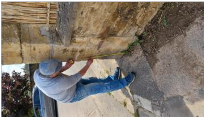
Laisse de crue à 80 cm/sol.