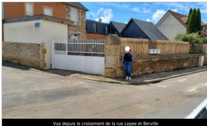
Vue depuis le croisement de la rue Lepee et Berville