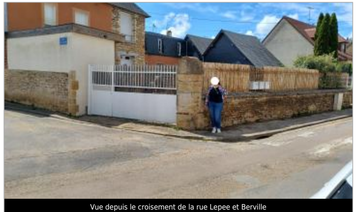
Vue depuis le croisement de la rue Lepee et Berville

Coordonnées WGS84 : X: -0.02719580 / Y: 49.01803470