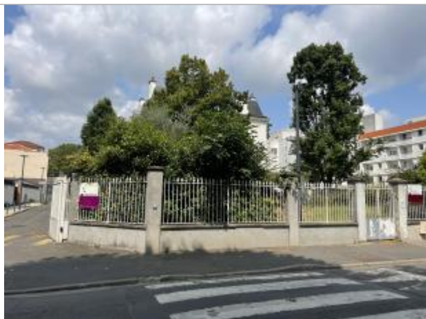
Repère de crue école de musique 1