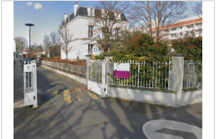
Ecole de musique

GÉOLOCALISATION Coordonnées WGS84 : X: 2.33534455 / Y: 48.93222170 Coordonnées RGF93 (Lambert 93) X: 651303.1 / Y: 6870454.28 Coordonnées RGF93 (ETRS89) : X: 2.3353446 / Y: 48.9322217 Code Hydro: ----0010 Rive de référence: