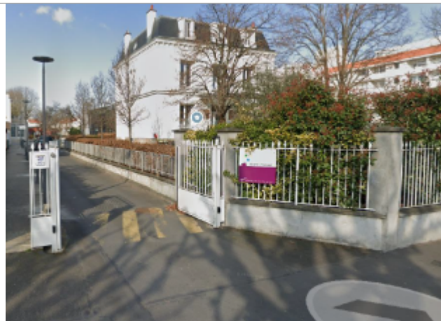
Ecole de musique

Coordonnées WGS84 : X: 2.33534455 / Y: 48.93222170