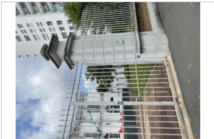
Repère de crue centre culturel 1

MARQUE Texte : Crue centennale type 1910 Maximum de l'inondation : Oui Visibilité : Oui État du repère : Bon Pérennité : Longue