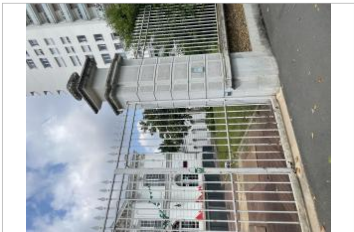
Repère de crue centre culturel 1